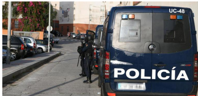
Spanische Polizisten stehen bei einem Einsatzfahrzeug.

Dutzende Migranten sind in Marokko Aufrufen in sozialen Netzwerken gefolgt: Sie versammelten sich auf einem Hügel an der Grenze zur spanischen Exklave Ceuta und griffen die Einsatzkräfte mit Steinen an. Es war nicht die erste Aktion dieser Art.